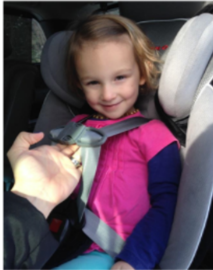
Despues de quitar el abrigo